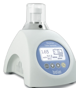
RTS-1C BS-010160-A04 Bioreattore personale

RTS-1C è un bioreattore personale che fornisce un tipo di agitazione a "rotazione invertita" e la registrazione in tempo reale della crescita microbica in provette da 50 ml.