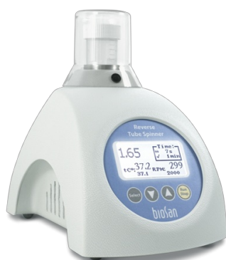
RTS-1 BS-010158-A04 Bioreattore personale

RTS-1 è un bioreattore personale che fornisce un tipo di agitazione a "rotazione invertita" e la registrazione in tempo reale della crescita microbica in provette da 50 ml.