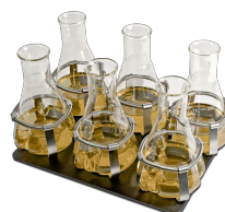
P-6/250 BS-010108-DK платформа