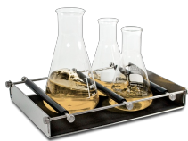
UP-12 BS-010108-AK платформа