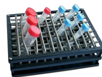
P-16/88 BS-010116-BK платформа

Платформа с пружинными держателями для 88 пробирок, диаметром до 30 мм.