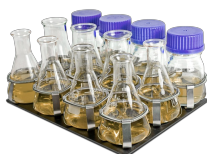
P-12/100 BS-010108-EK платформа